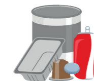
Tous les emballages en métal (conserves, canettes, capsules de café, aluminium,...)