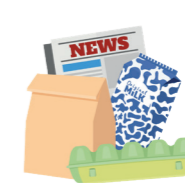
Tous les emballages en carton (briques, papiers, journaux, magazines,...)

400 ans avant que le plastique ne disparaisse, alors qu'avec 4 bouteilles recyclées on en fabrique 3 !