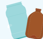
Bocaux, pots et flacons en verre (conserves, yaourts, miel, épices,...)