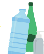
Toutes les bouteilles, pots et flacons en plastique