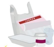
Tous les autres emballages en plastique (sacs, verres, pots et barquettes alimentaires,...)