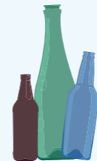
Bouteilles en verre (eau, huile, jus de fruit, alcool,...)

Parce que le verre est 100% recyclable , nous recyclons déjà 7 bouteilles sur 10 !