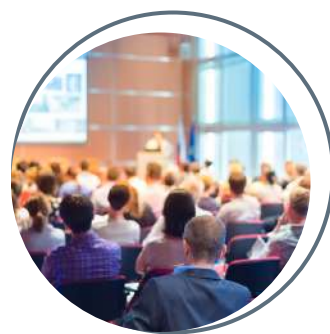
Conférences et ateliers

Pour développer durablement le tissu économique de la région