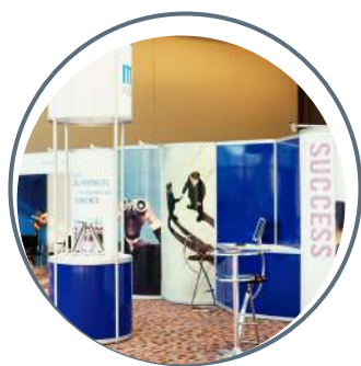
Plus de 120 exposants