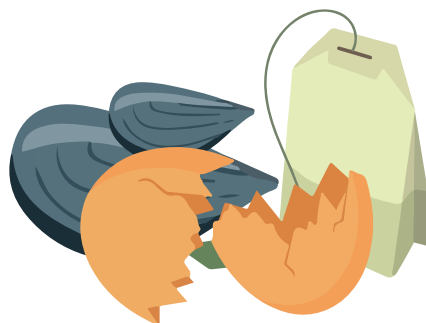
Thé et café, coquilles d'oeuf et coquillages

#FLEURS FANÉES #FEUILLES #ESSUIES-TOUT #ROULEAUX EN CARTON #SACS KRAFT #ÉPLUCHURES BIOSEAU #FRUITS #LÉGUMES #RESTES DE REPAS #THÉ #CAFÉ