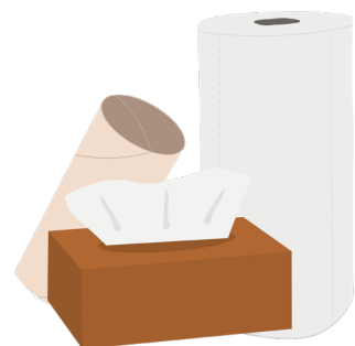
Essuies-tout, mouchoirs, rouleaux en carton et sacs kraft