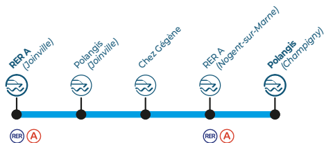
Le bateau «côche d'eau»